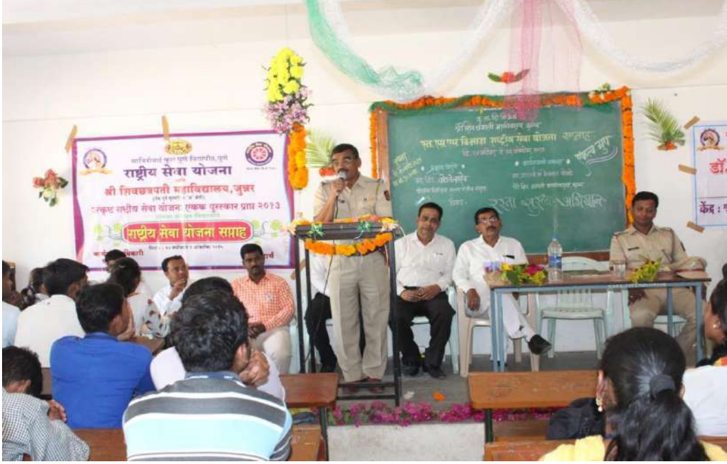
Photo of rally on Road safety campaign celebration