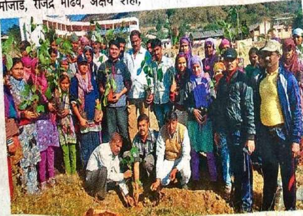
मढ येथे राष्ट्रीय सेवा योजना शिबिरात विद्यार्थ्यांनी.