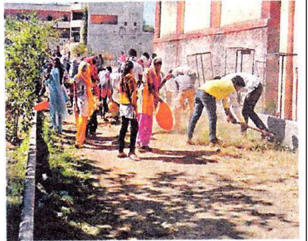
मढ येथे राष्ट्रीय सेवा योजना शिबिरात विद्यार्थ्यांनी स्वच्छता केली.