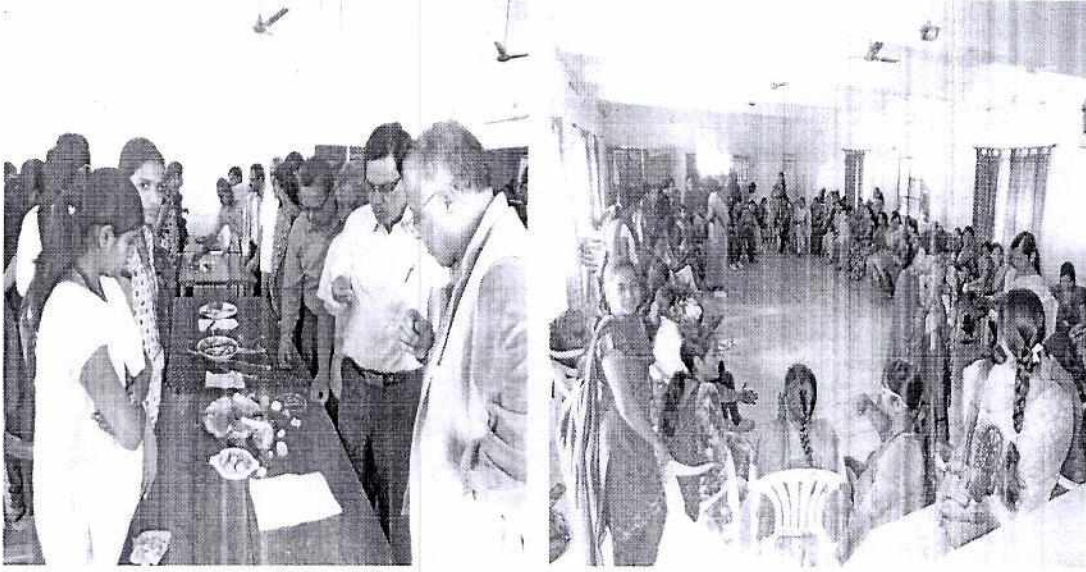
Vidyarthini Kalyan Mandal 2016-17 Food Festival